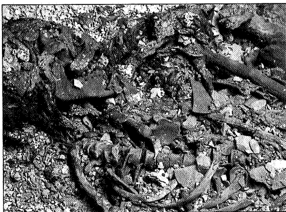
Lám. IV. Sepultura 121. Detalle del individuo adulto con la cabeza, pelo y hacha de cobre.

decúbito lateral izquierdo, con las piernas y brazos fuertemente flexionadas sobre el pecho. Era un hombre de 1,60 m. de altura que tenía entre 27 y 29 años cuando murió. Físicamente ofrece mediana robustez, con las inserciones musculares poco marcadas y tiene algunas señales que indican que realizó en vida duros trabajos.